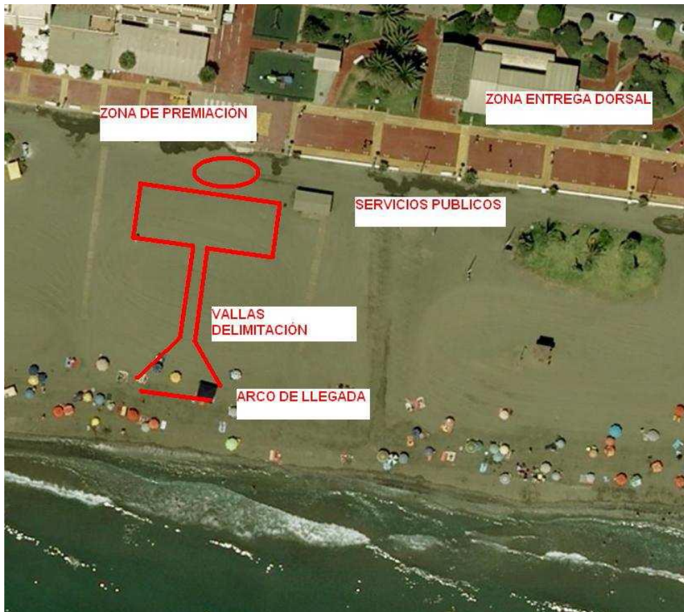
Imagen 8 Zona de llegada.