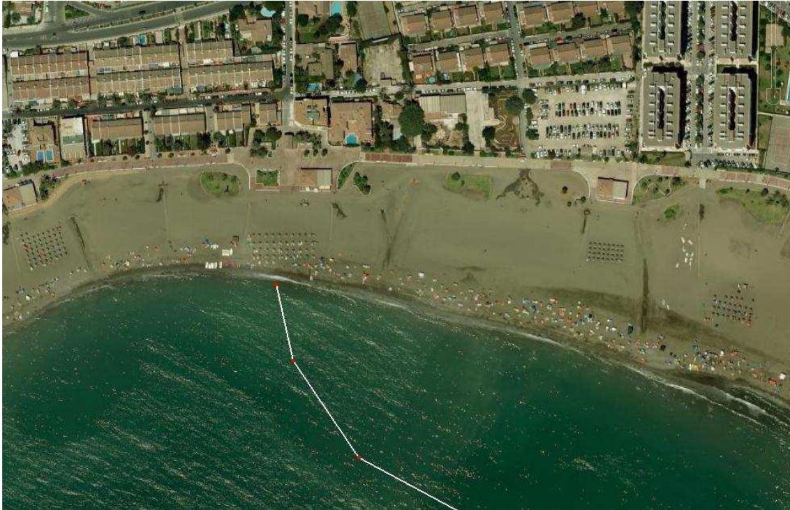
Imagen 2 Zona de inicio de la travesía. Playa de la Cala del Moral. 2.500 mts.