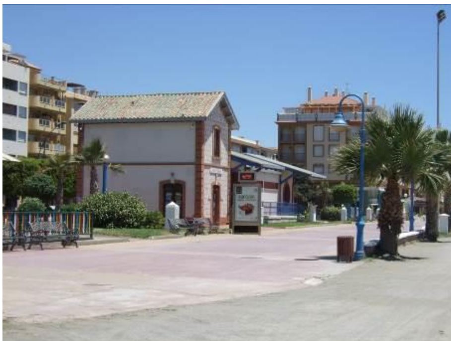
Foto 1 Oficina de Turismo Rincón de la Victoria.

La entrega de la bolsa del nadador se realizará el día de la prueba en el edificio de información turística del Ayuntamiento del Rincón de la Victoria (Foto1). En horario de 10:00 horas a 11:30 horas. Priorizando en primer lugar la travesía de 2500 metros y posteriormente la de 1000 metros.