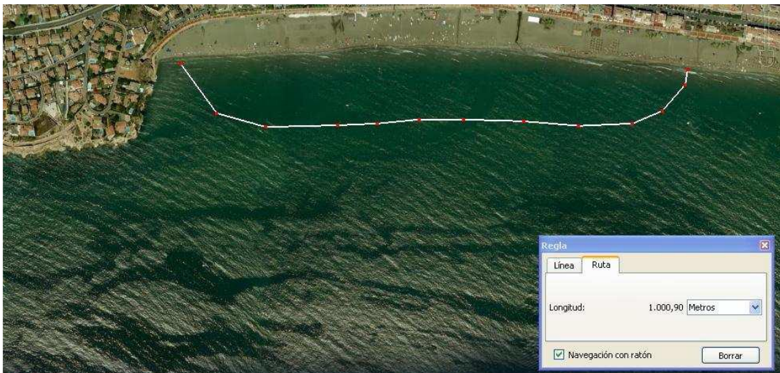
Imagen 5: Recorrido de nado (Virgen) 1.000 metros.