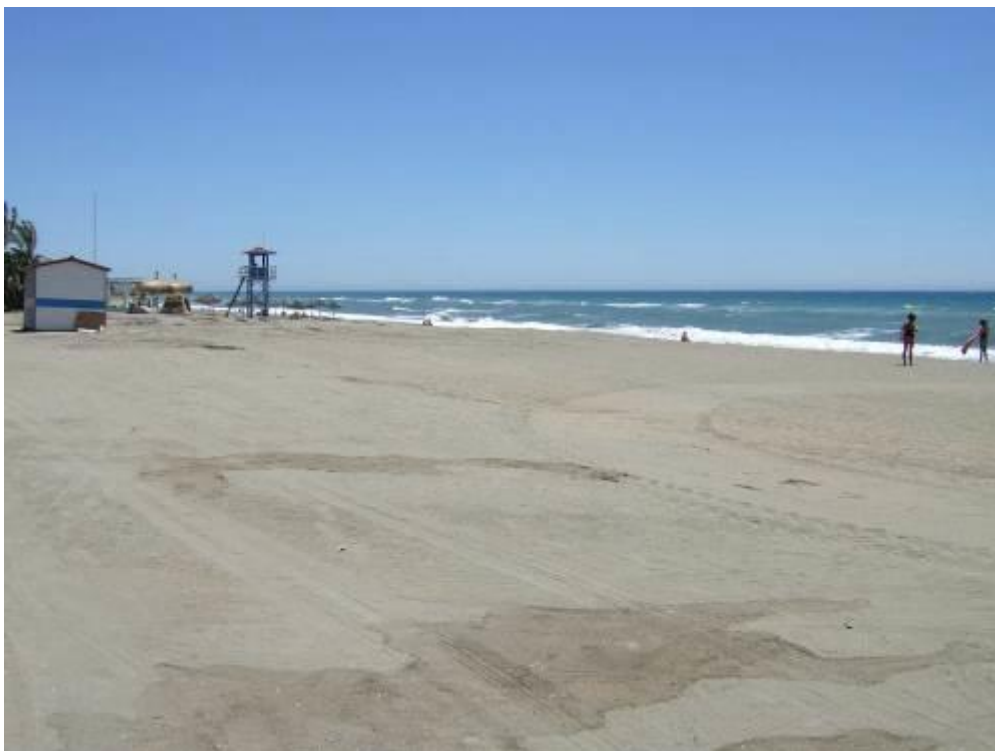
Foto 7 Zona de llegada con el servicio público al fondo.

Se tomarán todas la entradas en línea de meta, dando a conocer los puestos de los tres primeros de cada categoría y en listados se proporcionara el orden completo y definitivo de la prueba. Posteriormente mediante mensaje MSM recibirá cada nadador información del tiempo y posición de llegada.